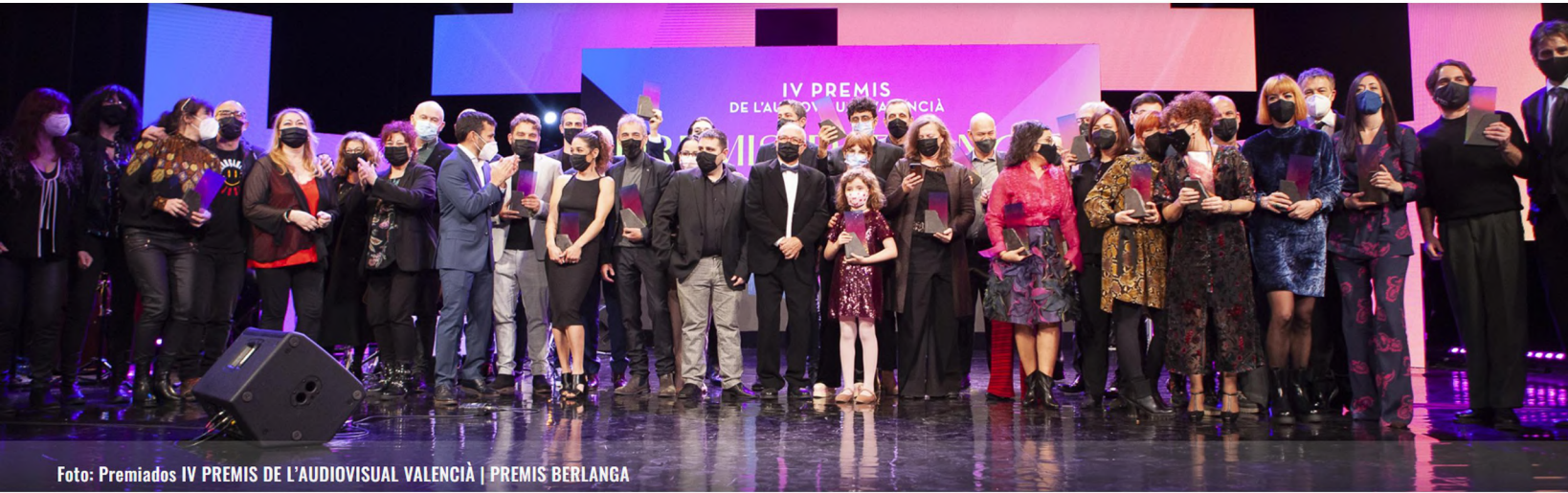
Foto: Premiadados IV PREMIS DE L'AUDIOVISUAL VALENCIÀ | PREMIS BERLANGA

El nostre principal objectiu és posar en valor l'Acadèmia, augmentar el seu prestigi i la seua projecció com a institució cultural imprescindible en la Comunitat Valenciana.